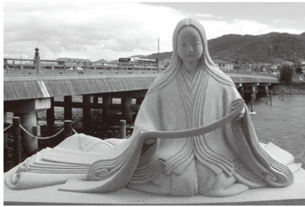
◀ 紫式部像 (宇治橋西詰)

宇治川マラソンは、世界文化遺産登録の「平等院鳳凰堂」や「宇治上神社」、また源氏物語の「宇治十帖」ゆかりの地や風光明媚な宇治川畔など、お茶と歴史に育まれた街並みとアップダウンに富んだコースをお楽しみください。