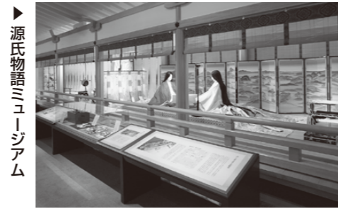
源氏物語ミュージアム