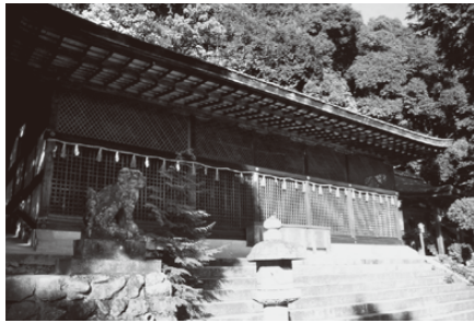
宇治上神社 (世界遺産)

宇治川マラソンは、世界文化遺産登録の「平等院鳳凰堂」や「宇治上神社」、また源氏物語の「宇治十帖」ゆかりの地や風光明媚な宇治川畔など、お茶と歴史に育まれた街並みと自然景観豊かな景勝地を取り入れた変化に富んだコースです。