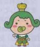
チャチャ王国のおうじさま

協力:宇治警察署・宇治市消防本部・(一社)宇治久世医師会・宇治市中学校長会・宇治市青少年健全育成協議会・宇治市女性の会連絡協議会 宇治市連合育友会・(社)宇治市社会福祉協議会・日本赤十字社京都府支部・赤十字レスキューチェーン京都・宇治写真協会 宇治川ライオンズクラブ・京都市城南ライオンズクラブ・京都京阪バス(株)・京阪ホールディングス(株)・西日本旅客鉄道(株)宇治駅 京都府建設業協会宇治支部・ユニチカ(株)宇治事業所・カイトプラクティク地域普及委員会・NPO法人オーソティックソサエティー関西(順不同)