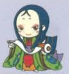
宇治市宣伝大使 ちほや姫

大会に関する問い合わせ先:宇治川マラソン大会実行委員会事務局 TEL.0774-22-1150