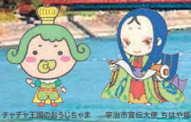
チャチャ王国のおうしゅま 宇治市宣伝大使 ちほや姫

ハーフ：先着 1,400名 10 km：先着 1,200名 5 km：先着 800名