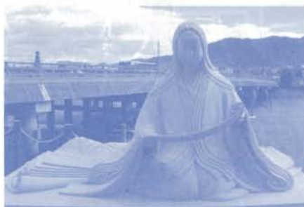
◀ 紫式部像 (宇治橋西詰)

宇治川マラソンは、世界文化遺産登録の「平等院鳳凰堂」や「宇治上神社」、また源氏物語の「宇治十帖」ゆかりの地や風光明媚な宇治川畔など、お茶と歴史に育まれた街並みとアップダウンに富んだコースをお楽しみください。